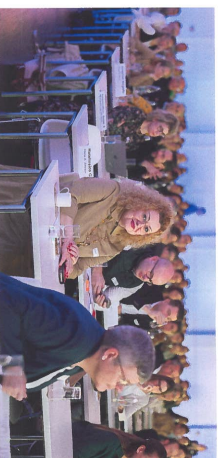
Mehr als 200 wisbegierige Branchenfachleute besuchten den diesjährigen Hotel Innovations-Tag mit dem Motto «Mutig führen, motiviert gestalten – stark in die Zukunft» im Verkehrshaus in Luzern.

emotionale und einfache Rekrutierungsprozesse zu etablieren. Eine spezifische Positionierung sei dabei extrem wichtig, damit die Stellensuchenden wissen, was sie beim Hotel erwarten können.